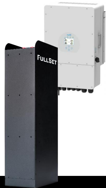
FullSet Pro 20.10

Energia jest dostępna zawsze wtedy, kiedy jej potrzebujesz: wieczorem, w nocy, w pochmurny dzień czy w przypadku awarii sieci. Możesz magazynować energię wyprodukowaną zarówno z instalacji fotowoltaicznej, jak i z sieci.